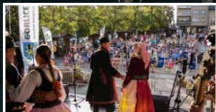
Folkowe zakończenie wakacji - s.2