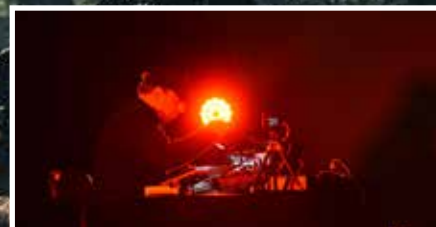
25. Ambient Festival - s. 15