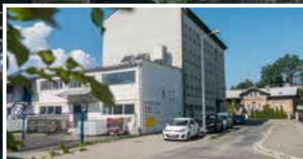
Będzie remont ul. Bardiowskiej - s.6