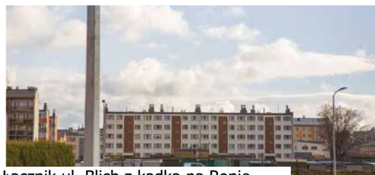
Łącznik ul. Blich z kładką na Ropie