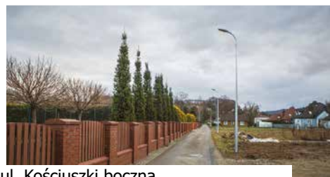
ul. Kościuszki boczna

Nowe ledowe oświetlenie, zyskało 6 gorlickich ulic – dwie ulice boczne od Kościuszki, ul. Graniczna boczna, łącznik ulicy Blich z kładką na rzece Ropie, łącznik ulicy Skrzyńskich z Jagodową oraz Kwiatowa boczna. Łącznik ul. Blich z kładką na Ropie Dbamy o ulice i uliczki - o potrzebie oświetlenia tych części miasta słyszałem od mieszkańców i od radnych. Nowe lampy z pewnością wpłyną na komfort dojazdów do posesji i poprawią bezpieczeństwo – mówi burmistrz Rafał Kukła. Wszystkie wymienione miejsca zyskały nowe słupy z wysięgnikami i oprawami ledowymi.