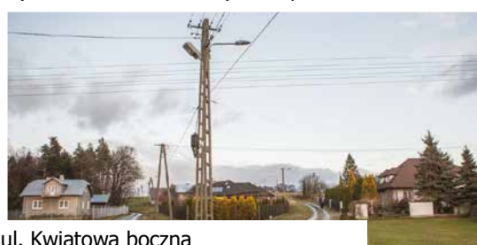
ul. Kwiatowa boczna