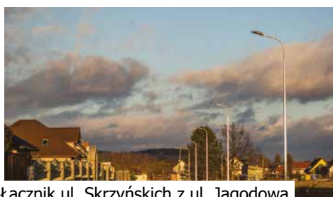
Łącznik ul. Skrzyńskich z ul. Jagodową