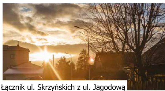
Łącznik ul. Skrzyńskich z ul. Jagodową

Nowe ledowe oświetlenie, zyskało 6 gorlickich ulic – dwie ulice boczne od Kościuszki, ul. Graniczna boczna, łącznik ulicy Blich z kładką na rzece Ropie, łącznik ulicy Skrzyńskich z Jagodową oraz Kwiatowa boczna. Łącznik ul. Blich z kładką na Ropie Dbamy o ulice i uliczki - o potrzebie oświetlenia tych części miasta słyszałem od mieszkańców i od radnych. Nowe lampy z pewnością wpłyną na komfort dojazdów do posesji i poprawią bezpieczeństwo – mówi burmistrz Rafał Kukła. Wszystkie wymienione miejsca zyskały nowe słupy z wysięgnikami i oprawami ledowymi.