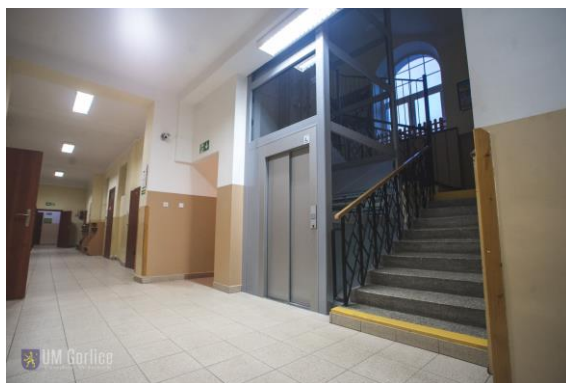
Winda i pochylnia w MZS Nr 3